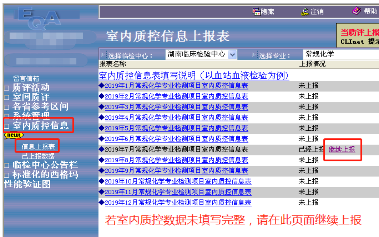
图 3 室内质控数据回报表的选择和继续上报页面示例

注：若在填报时不慎关闭了 IQC 上报页面，再次打开 EQA 回报表时，将不再弹出 IQC 上报页面，请参照上图点击相应月份的回报表再次上报或点击“继续上报”。