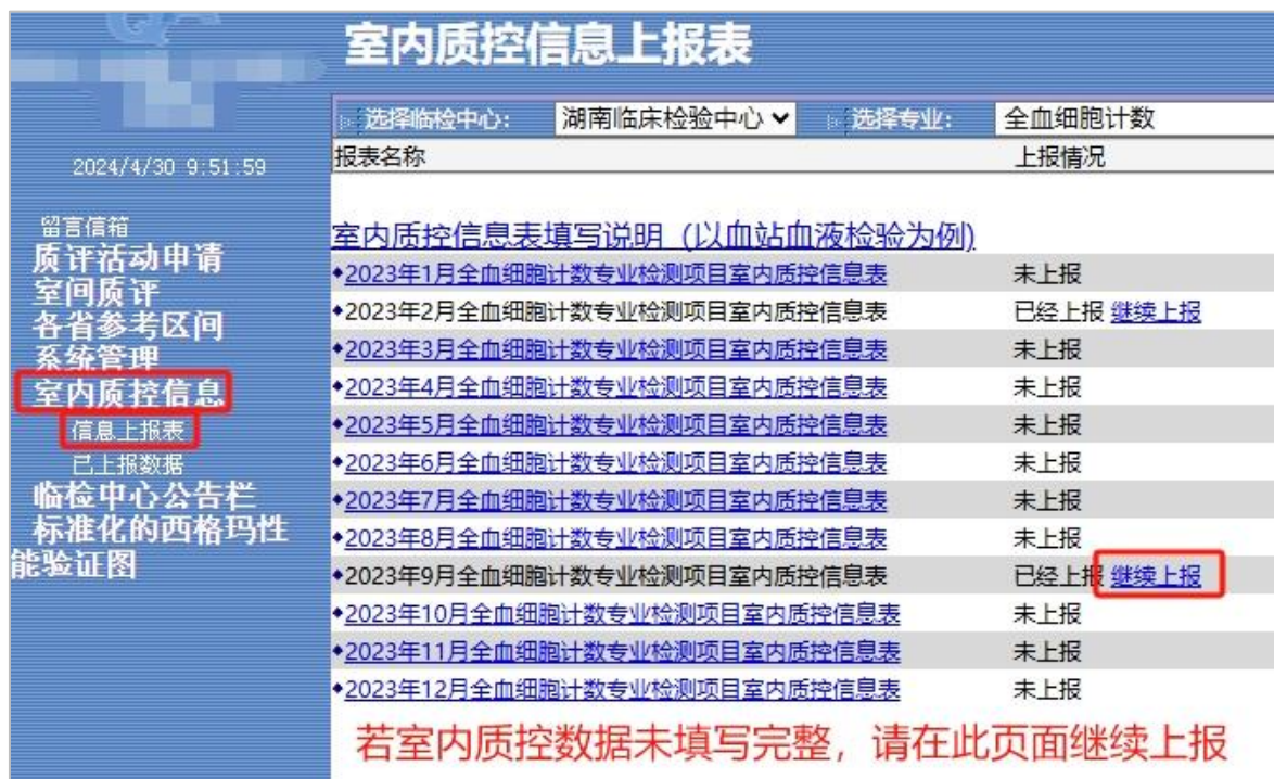
图3 室内质控数据回报表的选择和继续上报页面示例

注：如需对已上报数据进行修改，点击“重新上报”，将提示删除之前的数据，删除进入回报页面后，点击“加载”（见图1），将出现之前已保存的数据，然后再行修改。